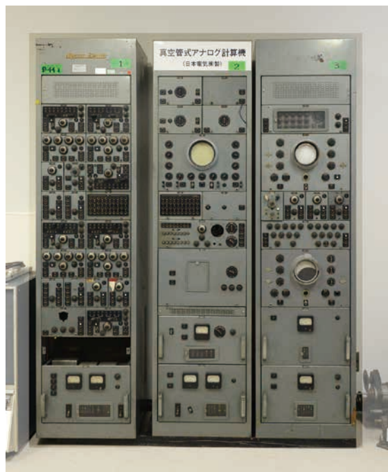
NEAC-R3 アナログコンピュータ 装置全景 左：積分器，加算器，係数器，符号変換器など 中央：制御盤，指示器，発振器，解サンプリング盤など 右：乗算器，折れ線近似盤，光学入力式任意関数生成器など

タを加え、1語の桁数を12桁に拡張。内部記憶には高速磁気ドラムが使用された。国内で大学自