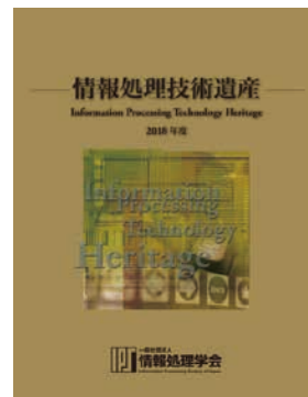
情報処理技術遺産パンフレット

モデルが通用しなくなったため、産学官の連携によるイノベーションの創出が重要であると指摘された。そのような環境の中で本会の果たす役割はきわめて大きいと強調され、ぜひ日本からチューリング賞の受賞者を出してほしいと期待を述べられた。