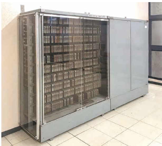
慶應義塾大学トランジスタ計算機 K-1