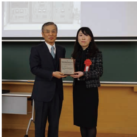
NEAC-R3 アナログコンピュータの所有者（右）と会長（左）