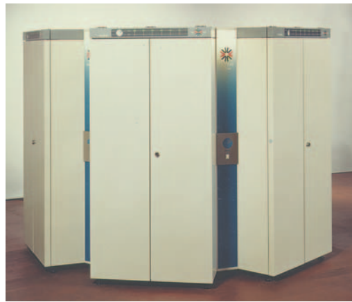
図3 5号機 QCDPAX (14GFLOPS)

そもそもコンピュータは、エンドユーザによって応用で評価されるべきものと筆者は信じている。PACSの性能評価も多くの現実的な応用を実装し測定された 1) 。性能評価論文を5つほど書いて、情報処理学会へ投稿した。最初の2論文はパスしたが、あとの3論文はリジェクトされた。それ以来、国内の学会に発表することはできるだけ避けた。予算獲得にも苦労した。伝を頼り、スポンサーを探して東京中を歩き回り、1日に4、5カ所も訪問したことを思い出す。